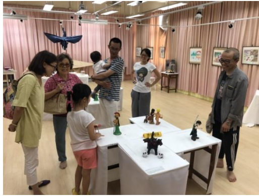
我的家長也來參觀。