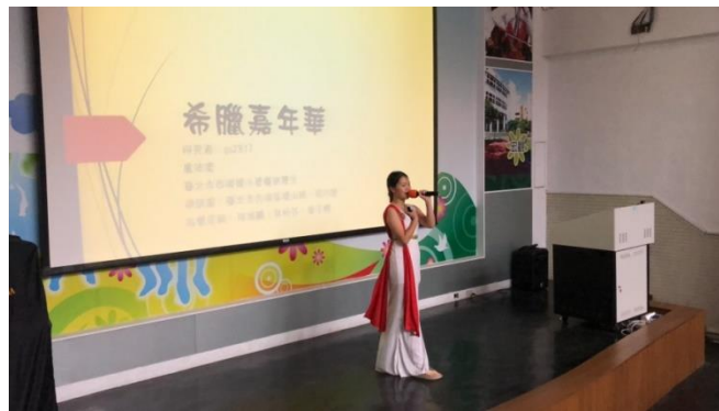
穿著女神的戰袍，雙眼緊盯著觀眾，以充實的內容和幽默感博得滿堂喝采！