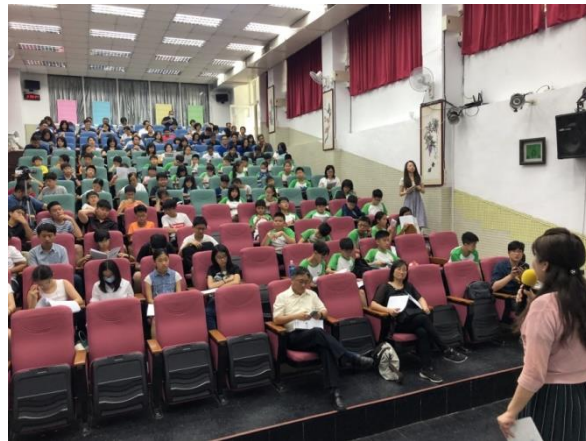
發表會當天人山人海，把會場擠得水洩不通，也讓我們更加緊張了。