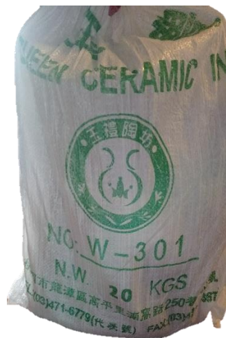
*1 剛買回來新鮮的白陶