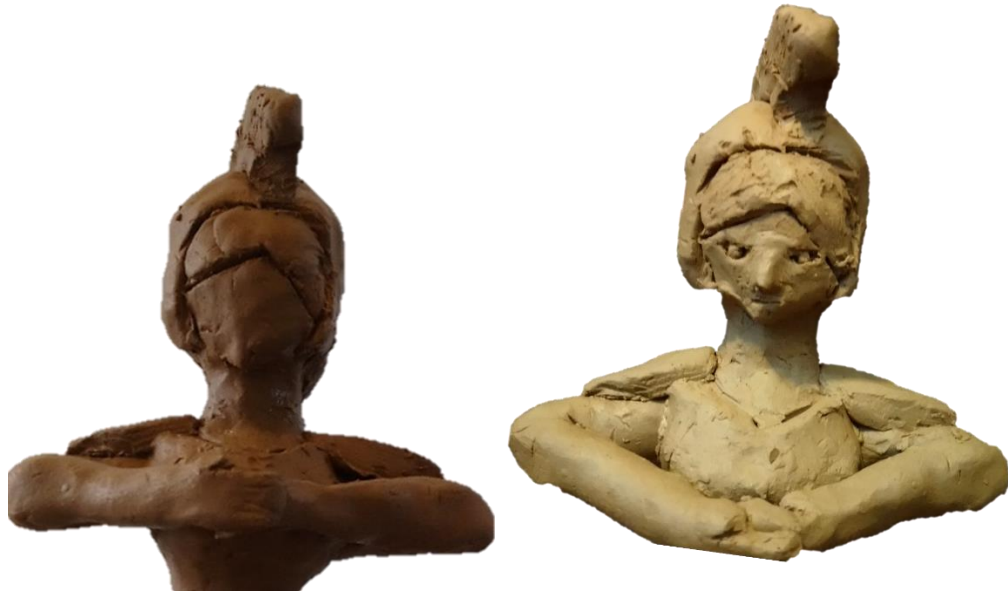
*3 五官刻好前和刻好後